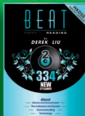
HKDSE Beat Paper 1 Reading (2)