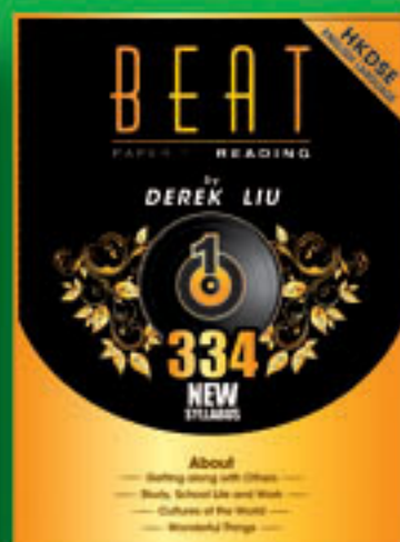
HKDSE Beat Paper 1 Reading (1)